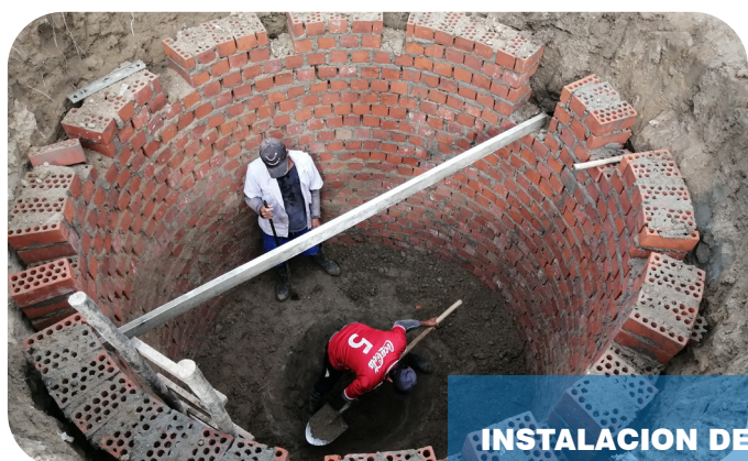
INSTALACION DE UN BIDIGESTOR DE 7000 LTS PARA USO DE SERVICIOS HIGIENICOS DE PLANTA CITRICOS