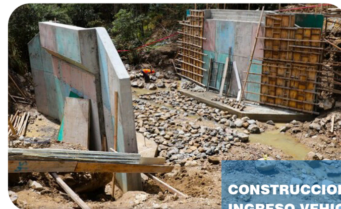
CONSTRUCCION DE PUENTE PARA EL INGRESO VEHICULAR ALA ZONA DE INGRESO A FUNDO