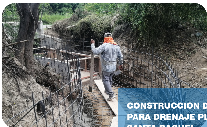
CONSTRUCCION DE 5 ALCANTARIAS PARA DRENAJE PLUVIAL EN FUNDO SANTA RAQUEL