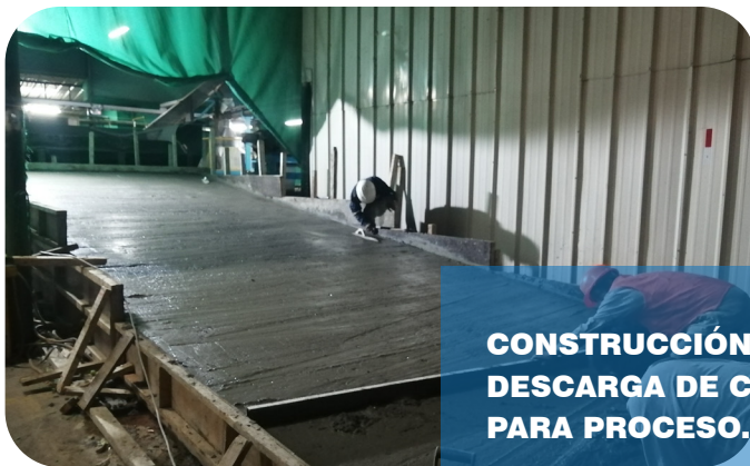
CONSTRUCCIÓN DE RAMPA PARA DESCARGA DE CASCARA DE LIMON PARA PROCESO.