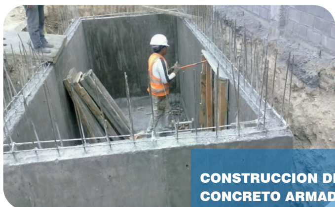
CONSTRUCCION DE UNA CISTERNA DE CONCRETO ARMADO CON CAPACIDAD DE 10 M3