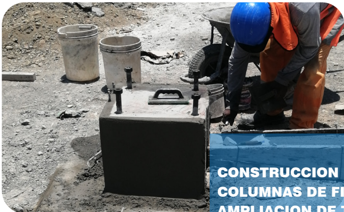
CONSTRUCCION DE PEDESTALES PARA COLUMNAS DE FIERRO PARA UNA AMPLIACION DE TECHO