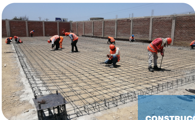
CONSTRUCCIÓN DE NAVE INDUSTRIAL PARA ALMACENES DE 1,500 M2 PARA CITRICOS PERUANOS