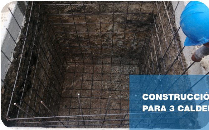
CONSTRUCCIÓN CAJA PAARA PURGA PARA 3 CALDERAS

EDIFICACIONES Y CONSTRUCCIONES EN GENERAL