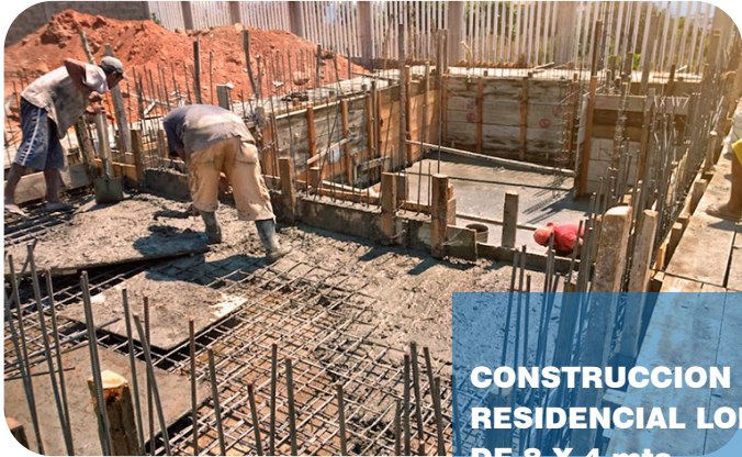
CONSTRUCCION DE PISCINA EN CASA RESIDENCIAL LOMA BLNCA LOS EJIDOS DE 8 X 4 mts

EDIFICACIONES Y CONSTRUCCIONES EN GENERAL