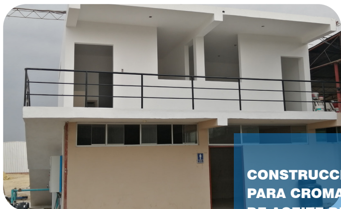
CONSTRUCCIÓN DE LABORATORIO PARA CROMATOGRAFO DE MUESTRA DE ACEITE DE CASCARA DE LIMON