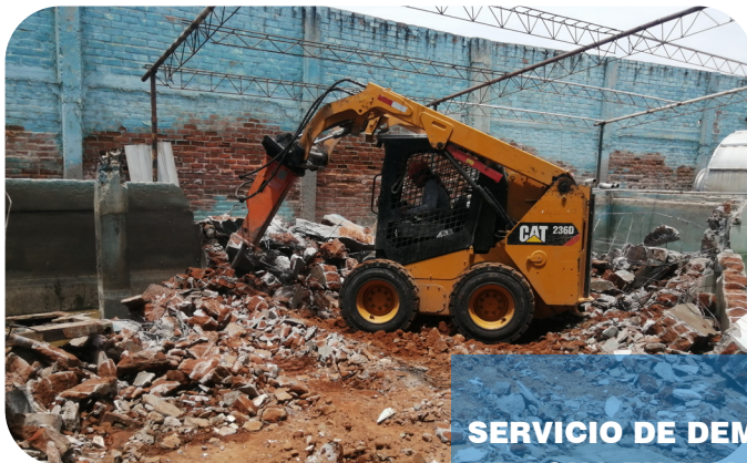
SERVICIO DE DEMOLICION DE PISCINAS DE AGUA EN MAL ESTADO PARA SU NUEVA CONSTRUCCION.