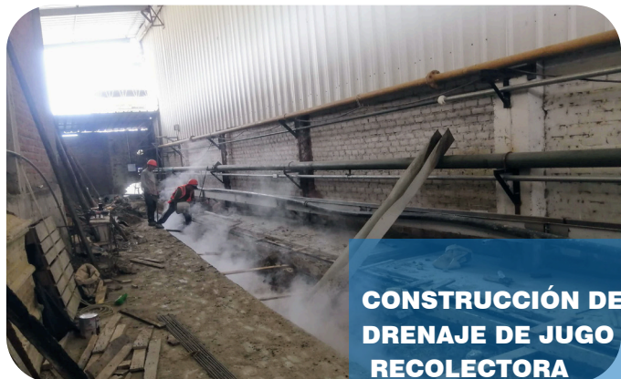
CONSTRUCCIÓN DE CANALETA PARA DRENAJE DE JUGO CALIENTE A POZAS RECOLECTORA

EDIFICACIONES Y CONSTRUCCIONES EN GENERAL