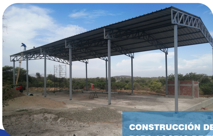
CONSTRUCCIÓN DE NAVE INDUSTRIAL PARA ACOPIO DE FRUTA COOPERATIVA (COPOFRES) SECTOR VALLE DE LOS INCAS TAMBOGRANDE - PIURA