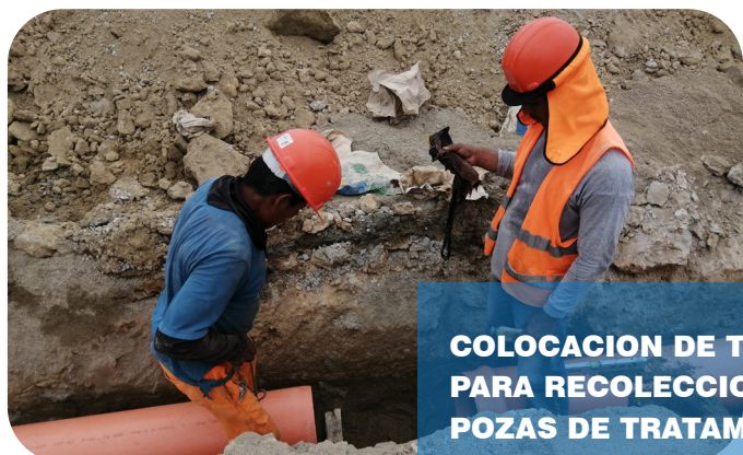
COLOCACION DE TUBERIA SANITARIAS PARA RECOLECCION DE AGUAS A POZAS DE TRATAMIENTO