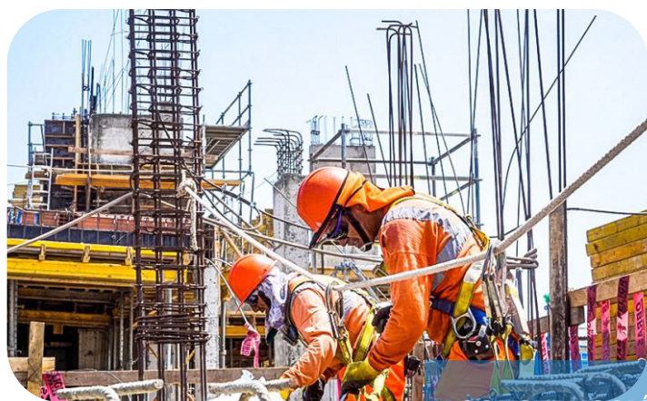
CONSTRUCCIÓN DE VIVIENDA MULTIFAMILIAR EN EL SECTOR LOMA BLANCA LOS EJIDOS PIURA

EDIFICACIONES Y CONSTRUCCIONES EN GENERAL