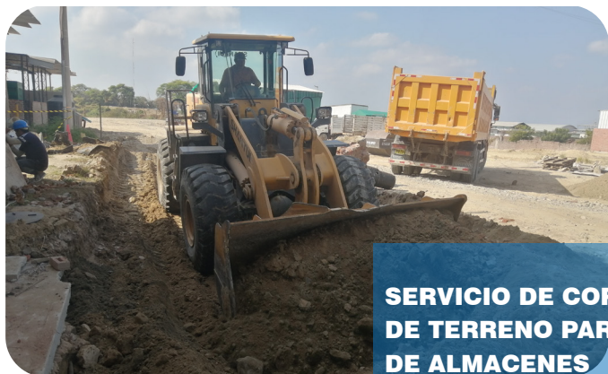
SERVICIO DE CORTE Y NIVELACION DE TERRENO PARA LA CONSTRUCCION DE ALMACENES

EDIFICACIONES Y CONSTRUCCIONES EN GENERAL